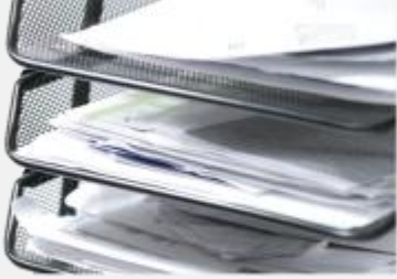
إدارة الصادر والوارد

# الحفاظ على التعديلات الحاصلة على الملفات عبر ميزة تعدد الإصدارات.