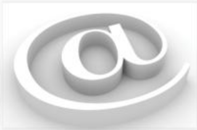
التكامل مع البريد الإلكتروني

# حماية الصادر والوارد من التلف والضياع.