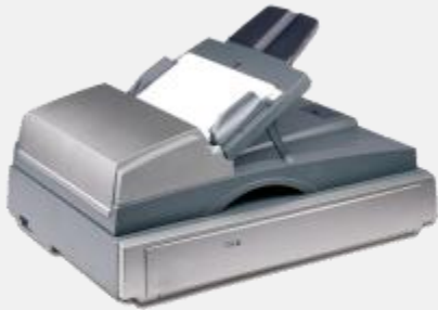
أرشفة المعاملات الورقية

# الحفاظ على التعديلات الحاصلة على الملفات عبر ميزة تعدد الإصدارات.